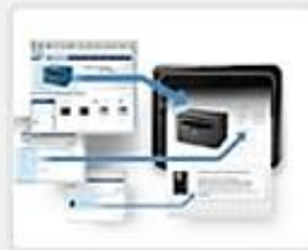
이지 캡처 매니저