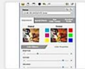
이지 컬러 매니저