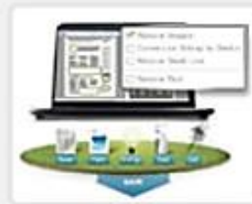
이지 에코 매니저